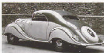
Art déco på fyra hjul. Ratten satt nästan mitt i bilen på 1936 års Panhard Dynamic.