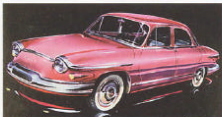
1961 års PL 17 hade tvåcylindrig motor på 42 hästkrafter. Fanns även som pickup och skåp.