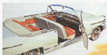
Tigre var prestandaversionen i PL 17-serien. Massor av krom, 50 hästkrafter vid 6 300 varv.