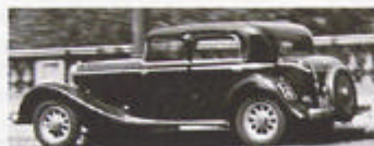
1930-talets Panhard-bilar var stora, tunga och dyra. Tysta också för de hade slidmotor.