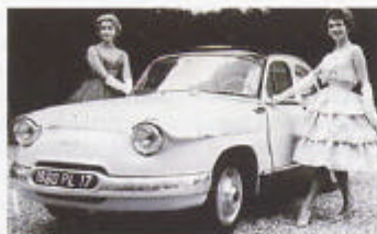
1960 års Panhard PL 17 hade stålkaross, 850-kubiksmotor och plats för sex åkande.