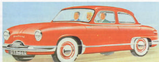
Precis som i Amerika: alla sitter fram! Motorn kallades Aérodyne och drog bara 0,6 l/mil.