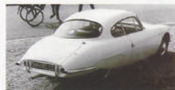
Panhard CD med kaross av glasfiberarmerad plast, en strömlinjeshöhet från 1958.